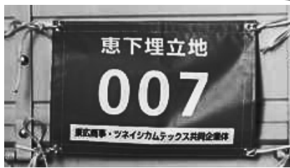
↑運搬する大型トラック ←紫色のゼッケンを付けたトラックには近づかないようにしましょう！